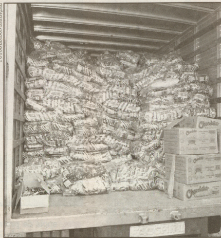
Além de 2.255 quilos de café, havia achocolatados e filtros