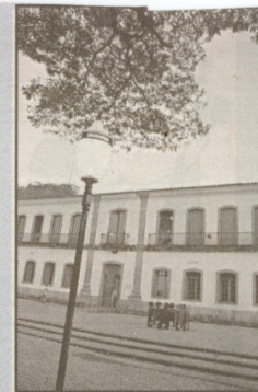
Inscrições na Cadeia Velha

Já os alunos dos cursos de pintura, balé, dança de rua, violão, teatro e pintu-