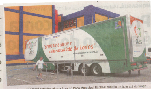
A carreta permanecerá estacionada na área do Paço Municipal Raphael Vitiello de hoje até domingo

O projeto objetiva disponibilizar à população carente exames médicos de baixa e média complexidade. Desde março do ano passado, a unidade móvel passou várias cidades, realizando mais de 5 mil procedimentos.