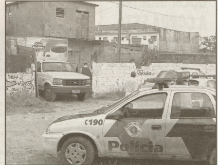
Todo o material foi encontrado no interior de uma casa